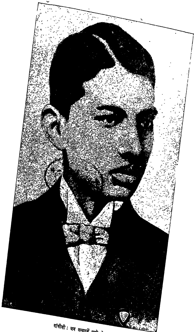
गांधीजी : जब लन्दनमें पढ़ते थे